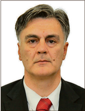
Siniša Karan, ministar unutrašnjih poslova RS-a