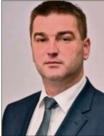
Srđan Todorović, poslanik NSRS-a